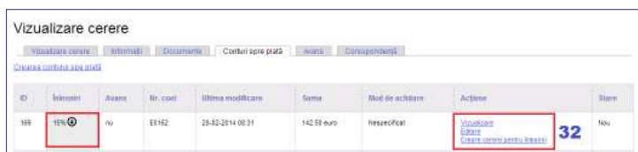
Fig. 6. Accesarea acțiunii Crearea cererii pentru înlesniri

A doua modalitate. În secțiunea Conturi spre plată , utilizatorul alege contul, la crearea căruia au fost solicitate înlesniri. În acest caz, pentru contul respectiv, în coloana Înlesniri , este indicat cuantumul înlesnirilor în „,%”. Cererea poate fi creată prin accesarea acțiunii Creare cerere pentru înlesniri din coloana Acțiune (32) (Fig. 6).