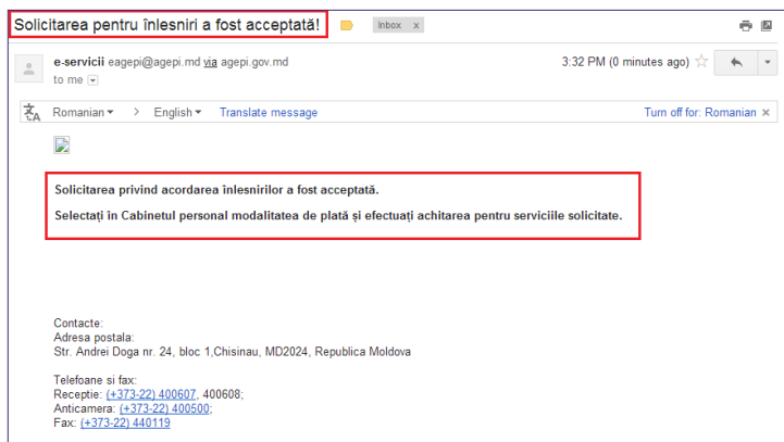
Fig. 10. Notificarea de confirmare a solicitării pentru înlesniri

După acceptarea sau respingerea cererii, veți primi o notifica-re prin e-mail și în CPL, în compartimentul Corespondență (Fig. 10).