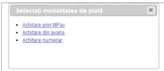
Fig. 12. Alegerea variantei de achitare a contului

Se va deschide caseta de dialog cu variantele disponibile de achitare a contului (Fig. 12).