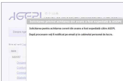
Fig. 14. Notificare de acceptare a cererii pentru achitare din avans

Odată cu schimbarea de către AGEPI a statutului cererii pentru achitare din avans, în CPL al utilizatorului, în secțiunea Corespondență , va fi expediată o notificare respectivă (Fig. 14).